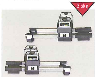
8センサーユニット