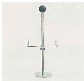
ステアリングホイールロック