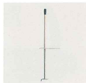
ブレーキペダルディプレッサー