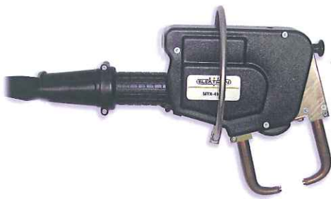
標準付属品の水冷式溶接ガンMTX4900