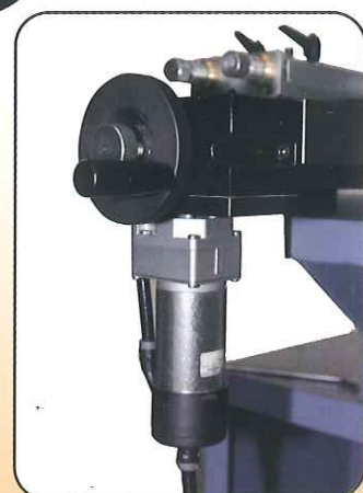
ディスク/ドラム兼用自動送り装置