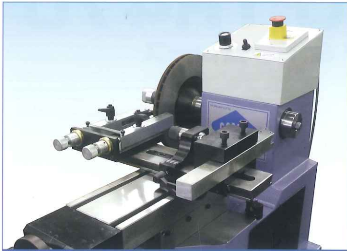
ディスク切削（送り方向はスピンドルに対して垂直）