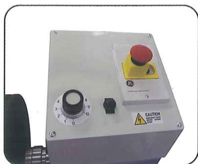
コントロールパネル