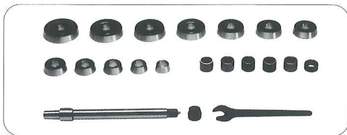
APS50 50mm アーバー・ディスク&ドラム用アダプターセット