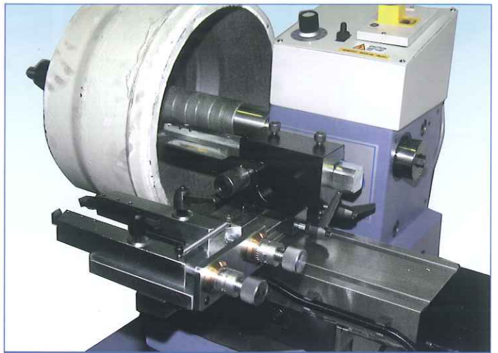
ドラム切削（送り方向はスピンドルに対して平行）