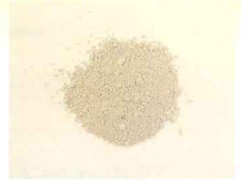
C B ボイラーによる完全燃焼の灰