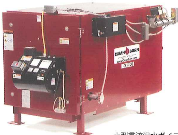
CB-350-CTB 小型貫流温水ボイラー 伝熱面積：6.3 m 2

燃料費・廃油処理費をダブルで節約！ 生活温水、洗車、床暖房、融雪にご利用いただけます！