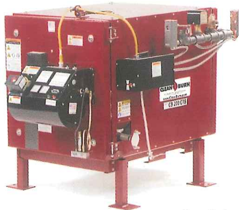
CB-200-CTB 簡易式ボイラー 伝熱面積：3.6 m 2